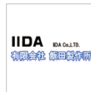
有限会社飯田製作所