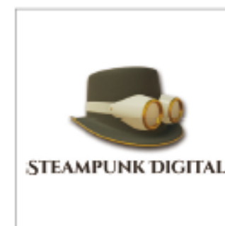
スチームバンクデジタル株式会社