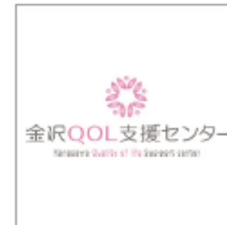
金沢QOL支援センター株式会社