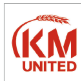
株式会社KMユナイテッド