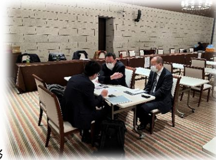
過去の相談会の様子