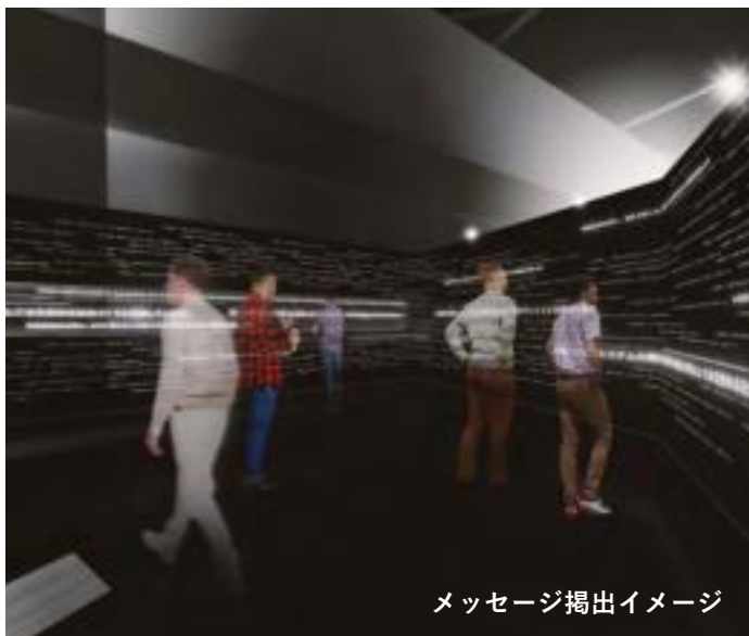
メッセージ掲出イメージ