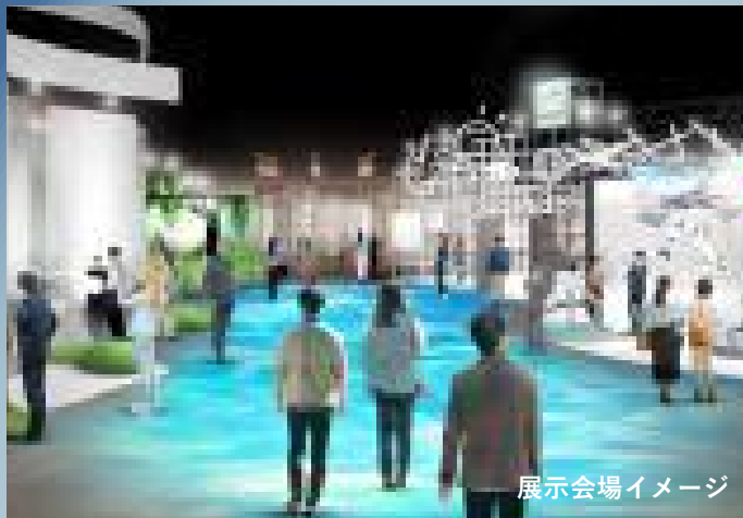
展示会場イメージ

展示を通じて、中小企業の持つ技術やアイデアに触れ、未来社会を実現する中小企業の魅力やその価値を世界へ向けて発信します。